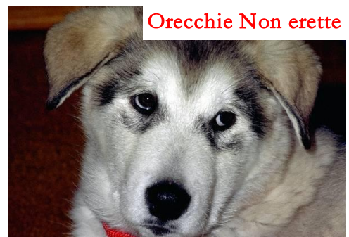
Orecchie Non erette

La Dentatura che sia a forbice o a tenaglia non è di fondamentale importanza, sia l'una che l'altra hanno pregi e difetti, con una chiusura a forbice la chiusura della bocca è sicuramente migliore, ma la tenaglia decisamente più funzionale per tranciare ossa, lacerare carne e perchè no schiacciare pulci, ma importante è che i denti siano forti, grossi e larghi devono poter frammentare senza problemi ossa o carne congelata.